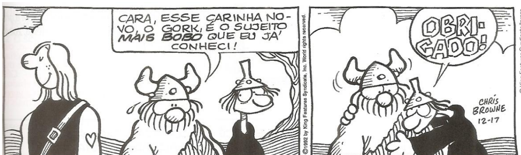
Hagar, de Chris Browne. Folha de S.Paulo, São Paulo, 15 out. 1993.

Leia este diálogo entre Hagar e seu amigo Eddie Sortudo e assinale a afirmação INCORRETA: