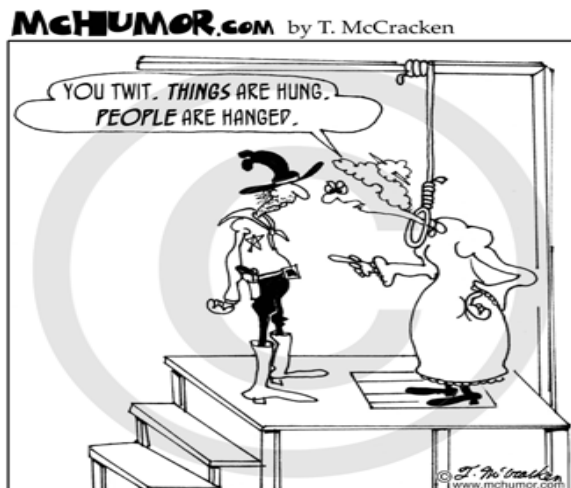
Why English teachers were rarely hung in the old west.

32) Observe the following cartoon and choose the correct option: